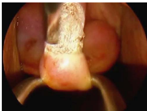
Figura 3 Detalle de la sección del tabique vaginal.

Entre el 15-25% de las pacientes con malformación uterina presentan problemas de fertilidad. De todos los tipos de