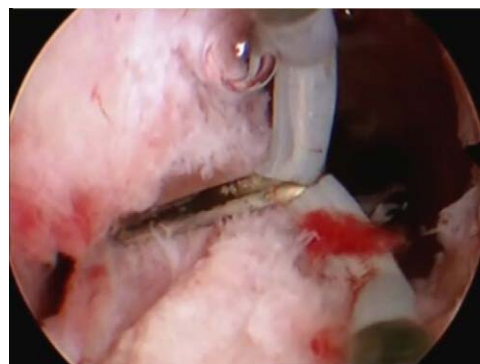
Figura 5 Sección del tabique utilizando resectoscopio y asa de Collins.

anomalías mullerianas, el útero septo es el que más se asocia a problemas reproductivos 4 .